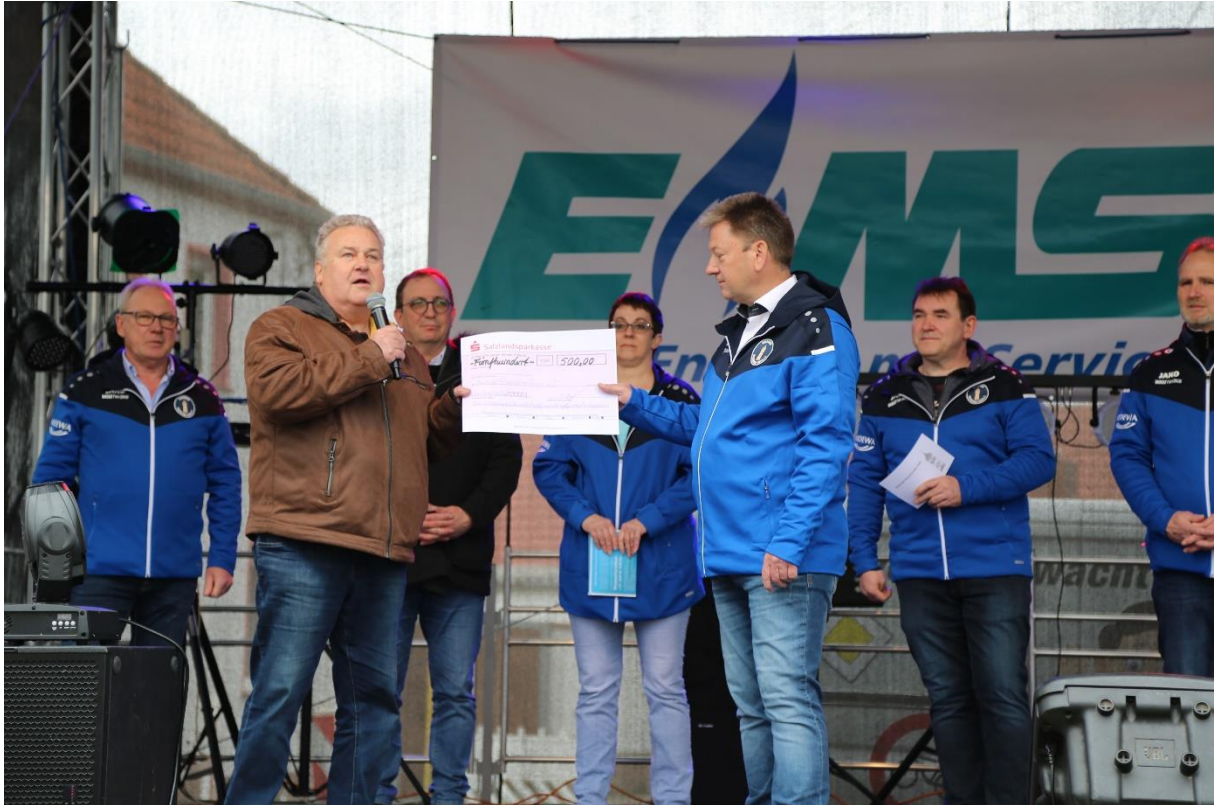
Vom „Verein zur Förderung der Kultur- und Denkmalpflege sowie Heimatpflege e.V.“ erhielten wir einen Scheck über 500,00 €