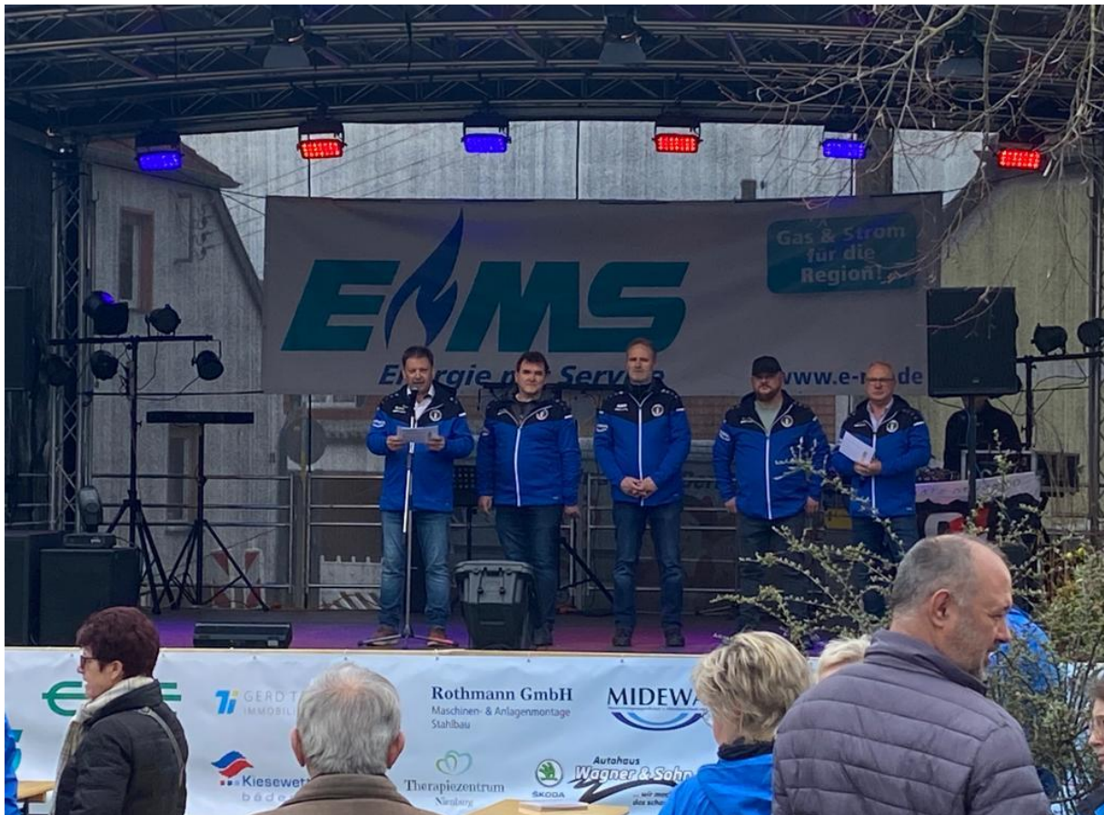
Der Vorstand eröffnete pünktlich um 14:00 Uhr