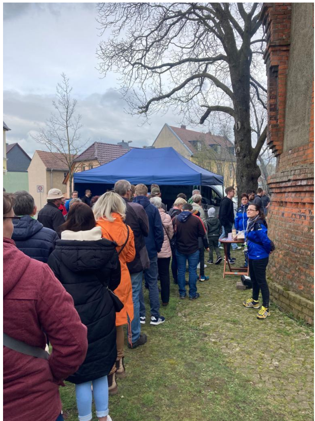
Schlange stehen zur Besichtigung