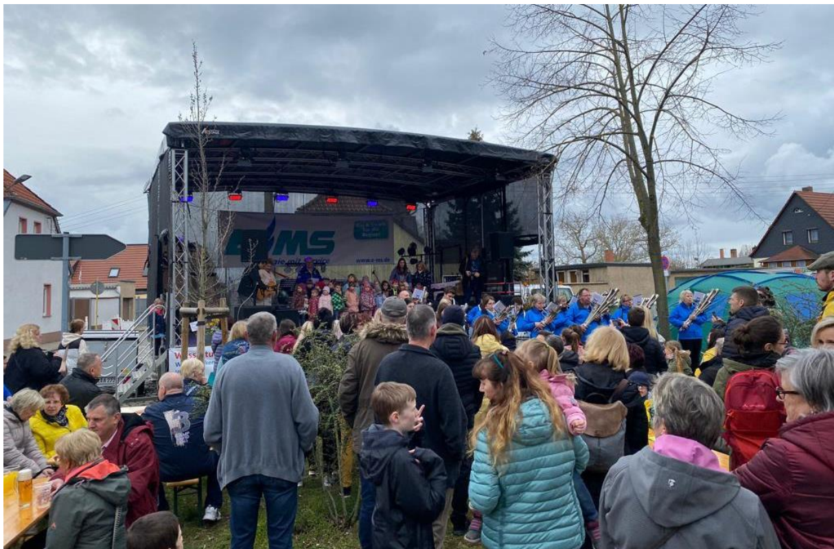
Ein buntes Bühnenprogramm zog viele Gäste an